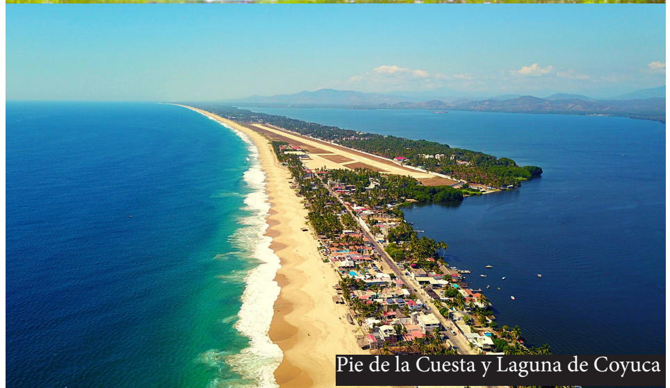
Pie de la Cuesta y Laguna de Coyuca